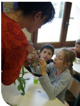
Animation dans une école à l'occasion de la Semaine du Gout