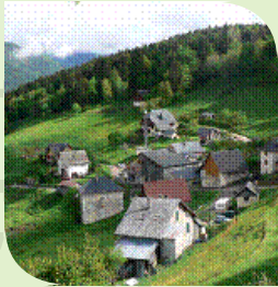
Village de Chartreuse

Pour cela, elle mène des enquêtes auprès des habitants d'un territoire pour recueillir les savoirs et les savoir-faire traditionnels et contemporains relatifs à la flore.