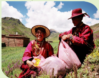
Moniales tibétaines en cueillette

Au Tibet , (province du Qinghaï), un bilan floristique et ethnobotanique a permis de mettre en évidence la nécessité de conserver des ressources végétales menacées par la mondialisation du recours aux pharmacopées traditionnelles.